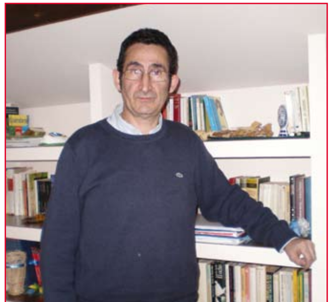
Leira coordinará as 17 agrupacións locais da zona

Leira xa comezou a traballar na coordinación destas agrupacións, “xa que queremos organizar actos en conxunto para as municipais para potenciar ás agrupacións onde estamos na oposición e seguir traballando nos concellos onde somos goberno”.